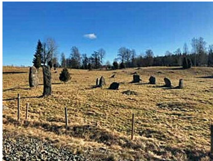
Stenkrets, gravfält, Byarum. Fornlämning.

Kommunen ska verka för att ha aktuella kulturmiljöutredningar och kulturarvsutredningar som bemöter hur kulturmiljövärden ska bevaras och utvecklas. Kulturmiljöunderlaget ska beaktas och användas i den ordinarie verksamheten.