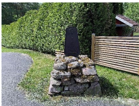
Milsten, Vaggeryd. Fornlämning.