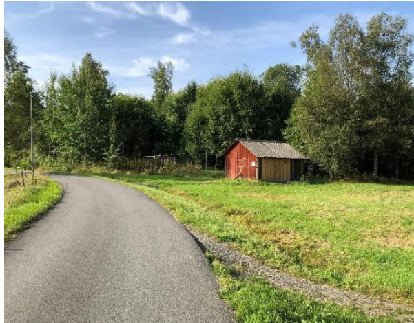
Henningas sommarladugård, Vaggeryd. Byggnad med kulturhistoriska värden.