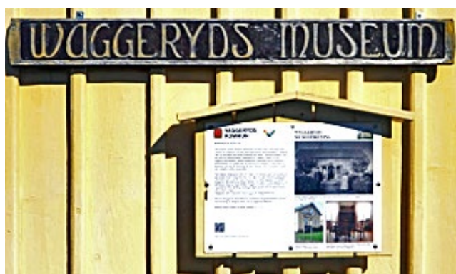
Waggeryds museum, Vaggeryd.

Kommunen upplever att finns ett betydelsefullt och givande samarbete om kulturarv med hembygdsföreningarna och hembygdsrådet. Inom föreningarna finns mycket information och kunskap om lokalhistoria och kulturarv att använda och utveckla inom kommunen.