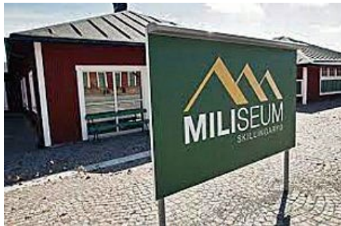
Miliseum, Skillingaryd. Skillingarydslägren, byggnadsminne.

Miliseum är ett militärhistoriskt museum i Skillingaryd som berättar om den indelte soldatens och soldatfamiljens liv samt ingenjörtruppernas verksamhet. Miliseum ligger inom det än idag aktiva militära övningsområdet i Skillingaryd. Miliseum ingår i museinätverket Sveriges Militärhistoriska Arv som består av 27 statliga och statligt stödda museer. Statens försvarshistoriska museer och Statens maritima museer leder och stöder det gemensamma nätverket tillsammans med kommunen.