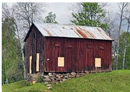
Holma sädesmagasin, Tofteryd. Byggnad med kulturhistoriska värden.

Skillingaryd skjutfält är riksintresse för försvarsmakten. Den militära övningsverksamheten som konstituerar riksintresset innebär även ljudutbredning av skottbullen utanför fältets gränser på motsvarande sätt som trafikbuller från vägar, järnvägar och flygplatser som berör områden utanför trafikanläggningar. Skyddet för riksintresset i detta fall består av att det inte tillkommer störningskänslig bebyggelse inom områden som berörs av centralt beslutade riktvärden för skottbullen, som på sikt innebär risk för begränsningar av verksamheten vid förnyad miljöprovning, s.k. påtaglig skada på riksintresset. Kommunen är skyldig att enligt plan- och bygglagen beakta risken för bullerstörningar vid provning av ansökningar om förhandsbesked och bygglov.