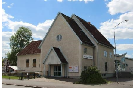
Vaggeryds Missionskyrka, byggnad med kulturhistoriska värden.