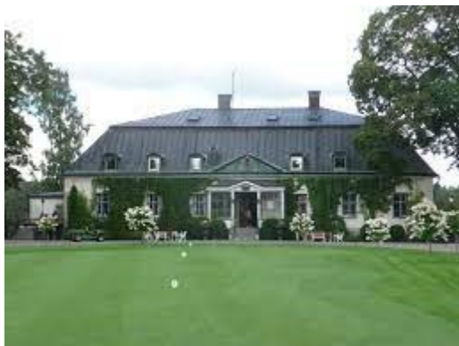
Hooks herrgård, Hok.

I kommunen finns en mångfald av spännande och intressanta kulturmiljöer, kulturhistoriska platser och byggnader. Flera är kända som populära besöksmål, ex. Miliseum, Hoks herrgård, hembygdsgårdar, Ålaryds skolmuseum. Här finns även flera vandringsleder, Munkaleden som ingår i Pilgrimsleder i Småland samt Höglandsleden som ingår i Smålandsleden.