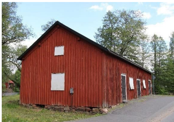
Järnboden i Götafors, Vaggeryd. Byggnad med kulturhistoriska värden.