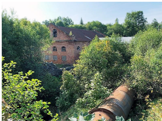
Hoks järnbruk, Hok. Industriellt kulturarv.

Den industriella utvecklingen har på ett avgörande sätt påverkat och utvecklat samhället. Det har förändrat människors arbetsliv, konsumtionsmönster, värderingar och livsformer, liksom för landskap, bebyggelse, teknikutveckling och produktionsutveckling.