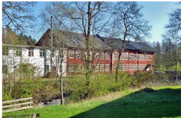
Hagafors Stolsfabrik, Svanerum. Industriellt kulturarv.

I kommunen finns en rik och mångsidig tradition av tillverkning och produktion, både som hantverk och i industrin. Det bestod av att tillverka olika föremål som verktyg, redskap, vagnar och möbler. Verksamheterna ägde rum på skilda platser som i stugor, smedjor och verkstäder eller på skogsmarken. Där skedde produktion av produkter som träkol, tjära, textil och pottaska. Industrialiseringen inbar även tillväxt och utveckling. Entreprenörer bidrog till nya företag och näringar. Exempel är Götafors järnbruk, Hoks järnbruk. Smedjor, kvarnar, sågverk och verkstäder är andra exempel på industriellt kulturarv i kommunen.