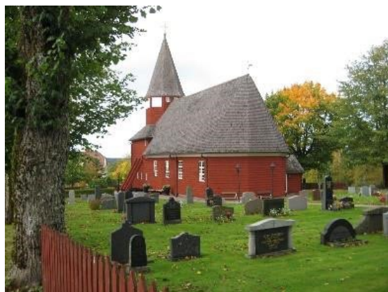
Bondstorps kyrka, kyrkligt kulturminne.