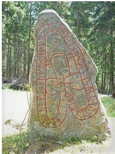
Runsten, Hok. Fornlämning.

Läs mer om fornlämningar och övriga kulturhistoriska lämningar i kommunen på Riksantikvarieämbetets databas fornsök, Fornsök (raa.se) .