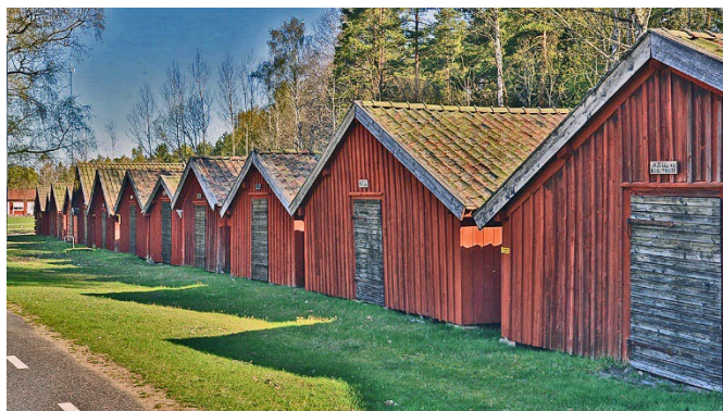
Åkers kyrkstallar, Åker. Byggnader med kulturhistoriska värden.