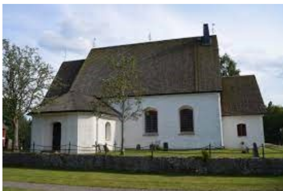
Hagshults kyrka, kyrkligt kulturminne.