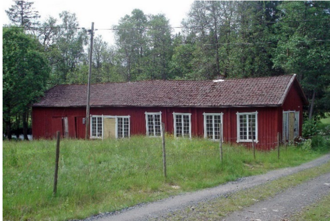
Hjulverkstaden i Kvarnaberg, byggnadsminne.