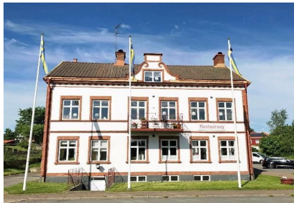
Det före detta Järnvägshotellet, Skillingaryd. Byggnad med kulturhistoriska värden.