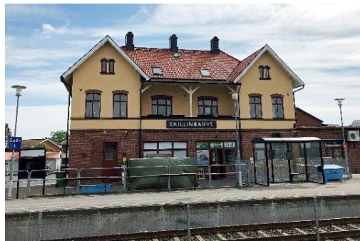
Järnvägsstationen, Skillingaryd, Byggnad med kulturmiljövärden.

Kulturmiljöerna i kommunen har en stor spännvidd. Kommunen är belägen i en gammal kulturbygd som är rik på fornlämningar, värdefulla odlingslandskap och kulturhistoriskt intressanta bebyggelsemiljöer. De äldsta spåren utgörs av boplatser från stenåldern, gravar från bronsåldern och järnåldern. Från yngre järnåldern, från vikingatiden finns flera kända runstenar. På landsbygden finns välbevarade byar med rötter i det äldre agrara kulturlandskapet. Flera större gårdslandskap finns kvar i omlandet kring sjöar och länge nyttjade jordbruksmarker. Kontinuiteten i stadsbilden visas genom bevarade byggnader och bebyggelsemiljöer från 1800-talets handels- och järnvägsorter, tingsplatser och sockencentrum. Det finns även ett rikt och intressant industriellt kulturarv efter olika verksamheter. I tätorterna finns modernistiska byggnader och kvarter av erkänt hög arkitektonisk kvalitet.