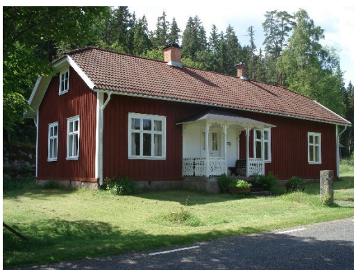
Ålaryds skolmuseum, Åker.

Därutöver finns ett stort antal mindre kända kulturmiljöer som är väl värda att uppmärksamma. Det är angeläget för kommun att stärka och långsiktigt utveckla samverkan med olika aktörer om kulturturism inom kommunen. Det finns även möjligheter att söka regionalt och nationellt stöd och bidrag till sådana projekt i olika format.