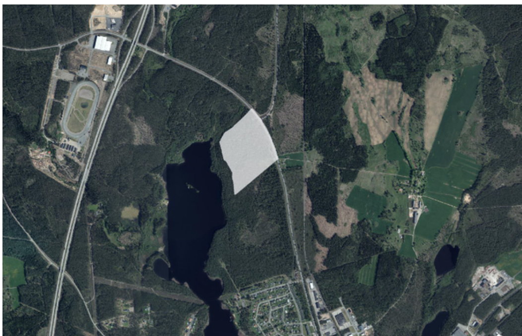
Figur 1. Planområde Östra strand.

Det är ett strategiskt lokaliserat utvecklingsområde med goda promenad- och cykelförbindelser in till Vaggeryd och kort pendelavstånd till Skillingaryd såväl som till Jönköping. Befintlig gång- och cykelbana, utmed den angränsande Jönköpingsvägen, är en stor tillgång för det tilltänkta bostads- och parkområdet för både boende och besökare.