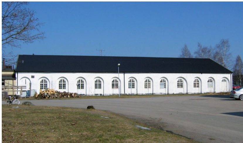
C. Svenssons smedja i Vaggeryd, som idag inrymmer Familjecentralen. Industriellt kulturarv.