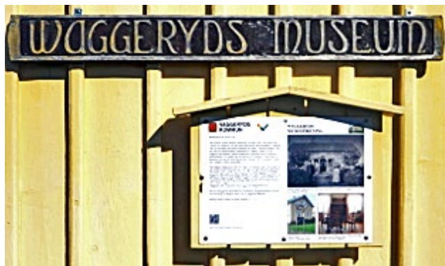
Waggeryds museum, Vaggeryd.

Kommunen upplever att finns ett betydelsefullt och givande samarbete om kulturarv med hembygdsföreningarna och hembygdsrådet. Inom föreningarna finns mycket information och kunskap om lokalhistoria och kulturarv att använda och utveckla inom kommunen.